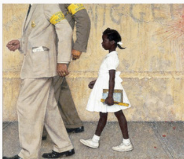
TABLEAU DE JUIN

"L'art est un mensonge qui nous permet d'approcher la vérité." - Pablo Picasso